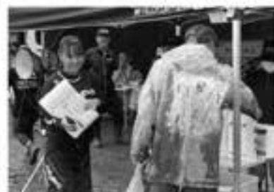
今回もジャンケンおじさん大活躍！新しいエナジードリンク「ZONE」の無料配布もあり大盛況…なぜか今回はトイレレットペーパーが多かった