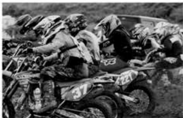
オフヴィ名物の鉄板網スタートは雨で滑るかと思われたが、泥が溜まって通常通りこのスタートがレースの順位を左右する上で重要